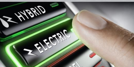
混合电动运输工具